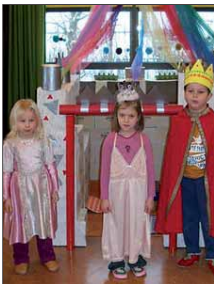
Mit viel Phantasie und großer Geduld wurde ein begeh- und bespielbares Märchenschloss gestaltet.