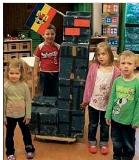
Großartige Bauwerke fabrizierten die Kinder der 1. Gruppe des Kindergartens Zeiselmauer. Auf dem Bild die Ruine „Zeiselstein“ mit dem Zeiselmauer Gemeindewappen. Bewundernswert!