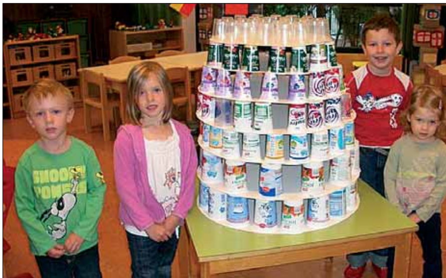
Was man aus Abfallmaterialien herstellen kann: Ein Meisterwerk von den Kindern aus Joghurtbechern.